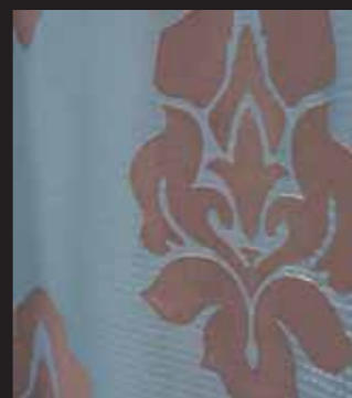
Lounge Sessel mit Polsterstoff JOOP! WASHINGTON. JOOP! PAISLEY Kissen, Rückseite in Multistripes. Vorhang aus Dekostoff JOOP! BELFORT mit Webstreifen Multistripes. JOOP! CHATOU Gardine in Jacquardstoff in Organza.