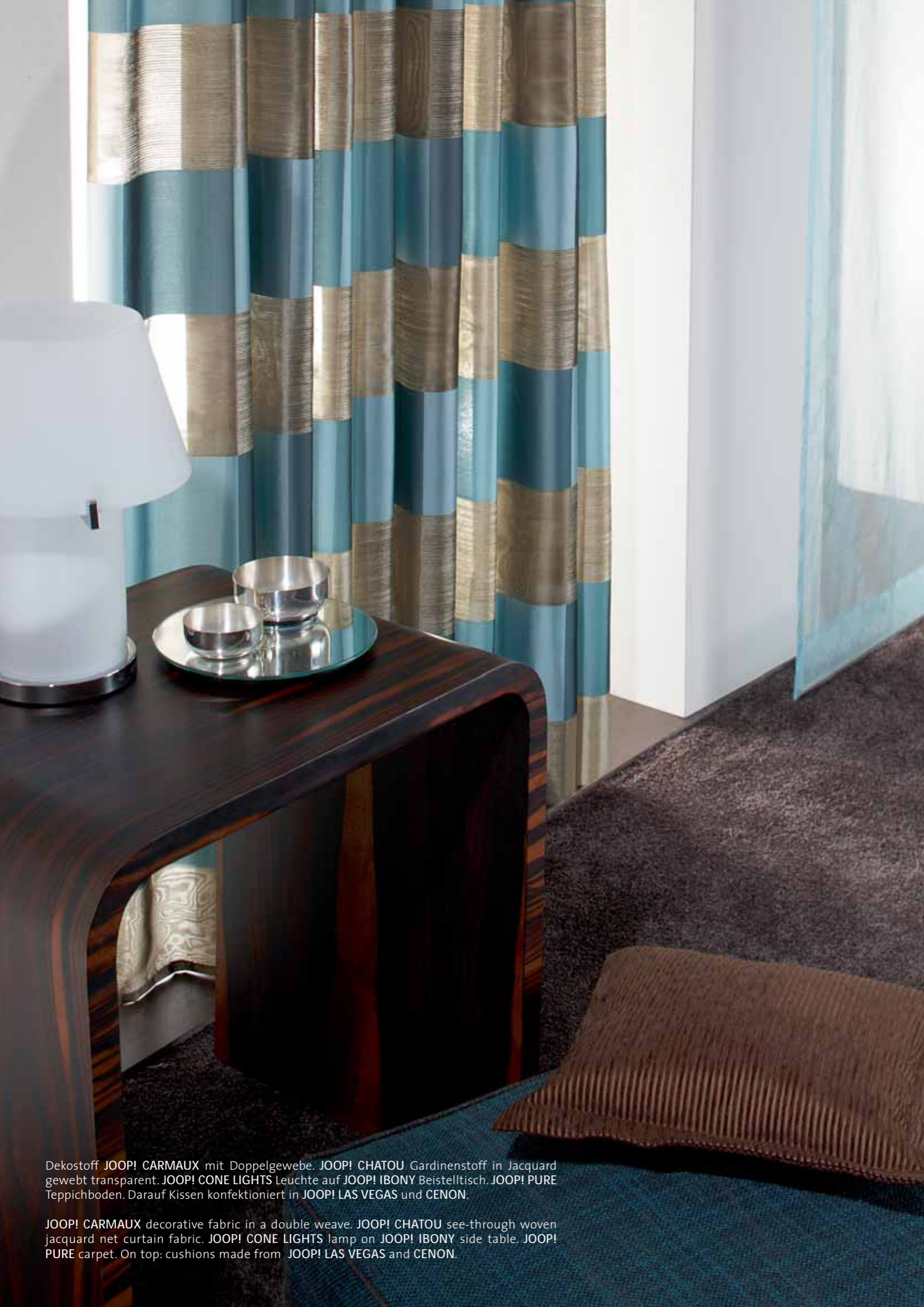
Dekostoff JOOP! CARMAUX mit Doppelgewebe. JOOP! CHATOU Gardinenstoff in Jacquard gewebt transparent. JOOP! CONE LIGHTS Leuchte auf JOOP! IBONY Beistelltisch. JOOP! PURE Teppichboden. Darauf Kissen konfektioniert in JOOP! LAS VEGAS und CENON.