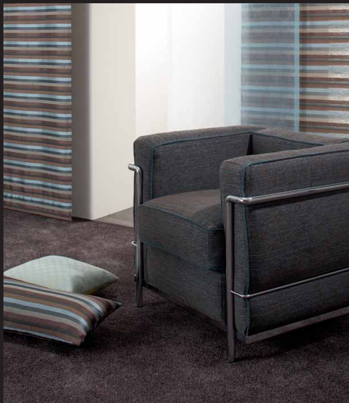
Lounge chair upholstered in JOOP! WASHINGTON. JOOP! PAISLEY cushion with reverse side in Multistripes. Curtain made from JOOP! BELFORT woven multi-striped fabric. JOOP! CHATOU jacquard organza net curtain.